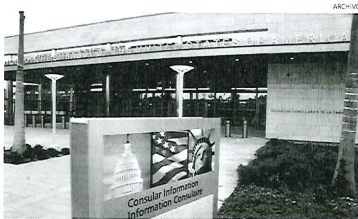
Sede de la embajada y el consulado de Estados Unidos en República Dominicana.

En referencia a la foto de un pasaporte en el que se aprecia una visa estadounidense expreso: "Si puedo decirle que una imagen de una supuesta visa, no es