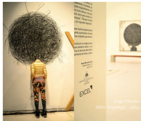
Jorge Pineda, “Año: Superego”, 2015.

02. Tenemos un acuerdo con el Centro León para apoyar a la difusión del arte y la cultura de la República Dominicana . Este convenio tiene el objetivo de dar a conocer las obras de reconocidos artistas plásticos de larga trayectoria, contribuyendo al desarrollo de diversas exposiciones.