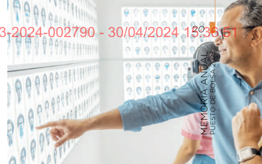
MEMORIA ANDAL PUESTO DE BOLSA, 2023