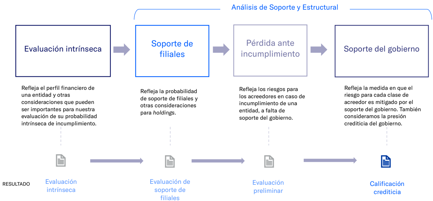
FIGURA 1 Enfoque general para calificar instituciones financieras de crédito

La presente metodología de calificación incorpora (i) un análisis de los factores de la evaluación intrínseca de instituciones financieras de crédito; (ii) otras consideraciones; (iii) evaluaciones de soporte de filiales para instituciones financieras de crédito y sus holdings ; (iv) una guía para el ajuste de escalones; (v) una evaluación del soporte y la intervención del gobierno; (vi) la asignación de calificaciones de emisor y de instrumentos; (vii) limitaciones generales; (viii) las escalas de calificación de SCR República Dominicana; y (ix) una descripción de proceso de calificación.