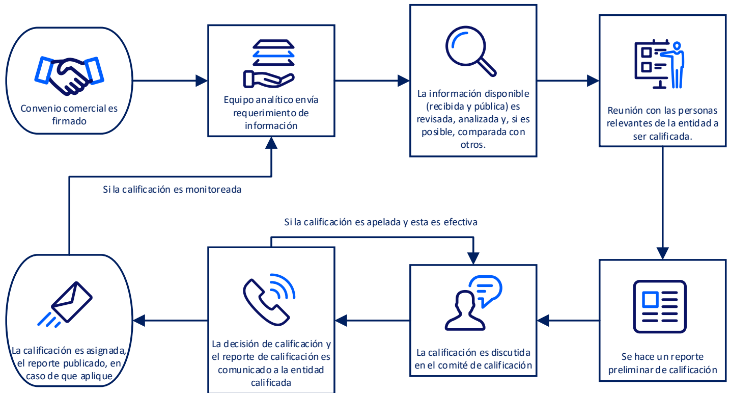
FIGURA 10 Representación gráfica del proceso de calificación

El proceso de calificación se divide en dos etapas diferentes: el proceso de calificación inicial y el proceso de supervisión de la calificación. En general, el proceso para ambas etapas se describe en el siguiente gráfico.